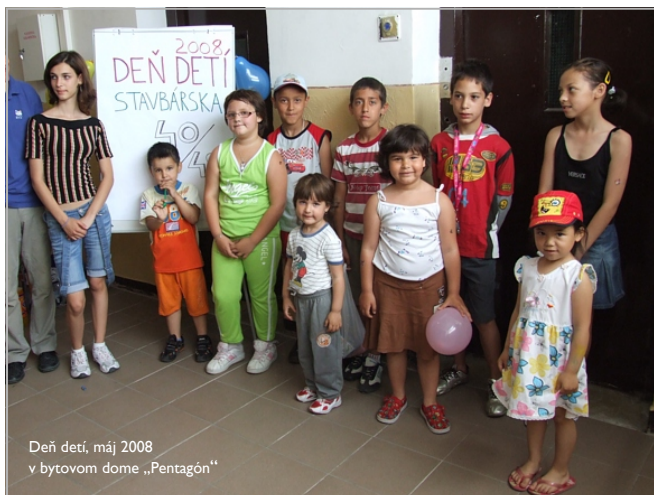
Deň detí, máj 2008 v bytovom dome „Pentagón“

Sociálna prevencia kriminality a aktivity týkajúce sa vymožitelnosti práva a využívania legislatívy za účelom zlepšovania podmienok bývania na sídliskách vytvorili štruktúru nového projektu SILOČIARY BEZPEČNOSTI .